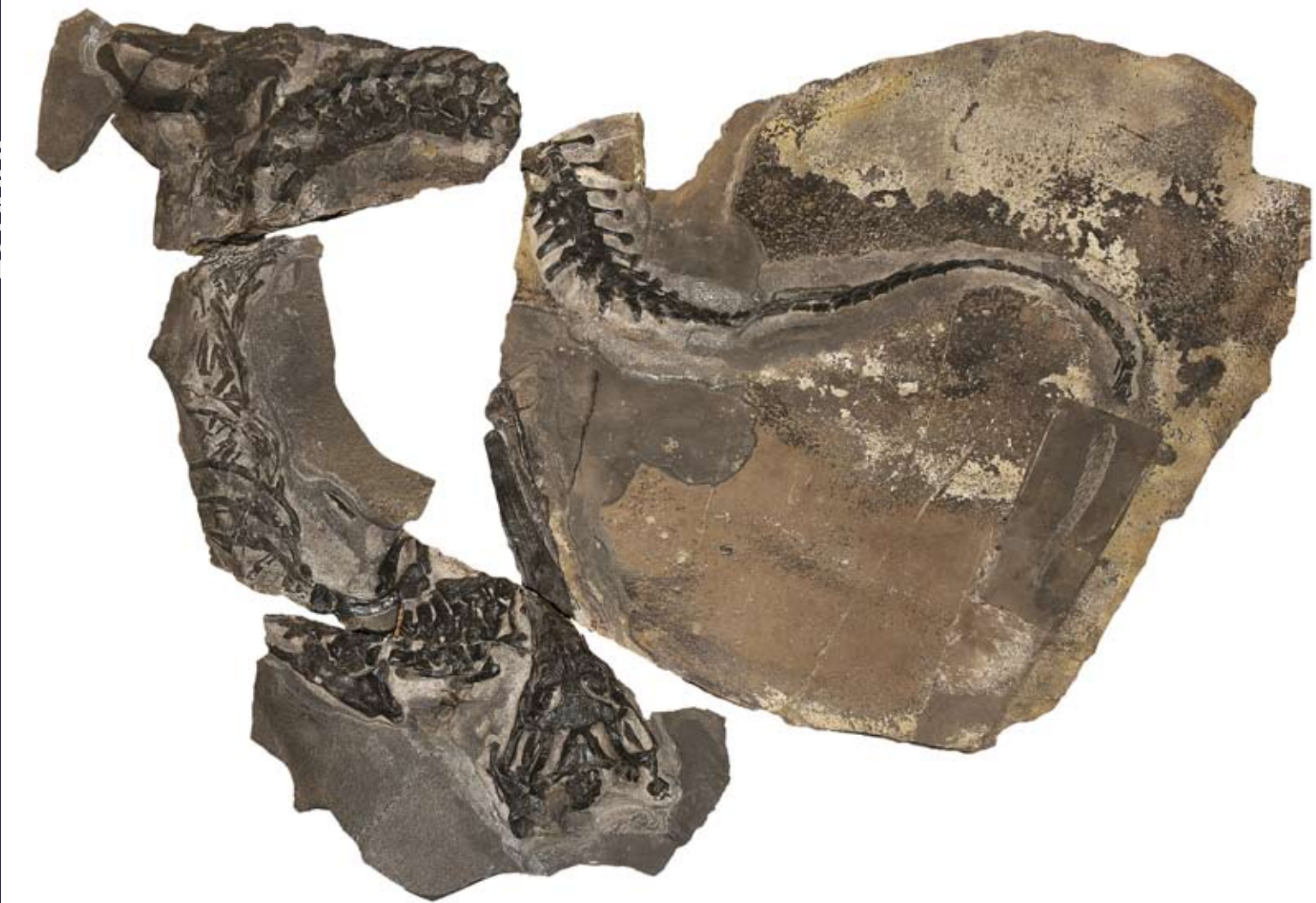
Fitosauro ( Mystriosuchus sp.) – Triassico sup. – Zogno (BG) – 10087 – foto Franco Valoti

L'opera di persuasione dell'allora presidente prof. G. Galizzi fa assegnare al Museo di Bergamo questo importante e prezioso reperto, conteso da altre istituzioni.