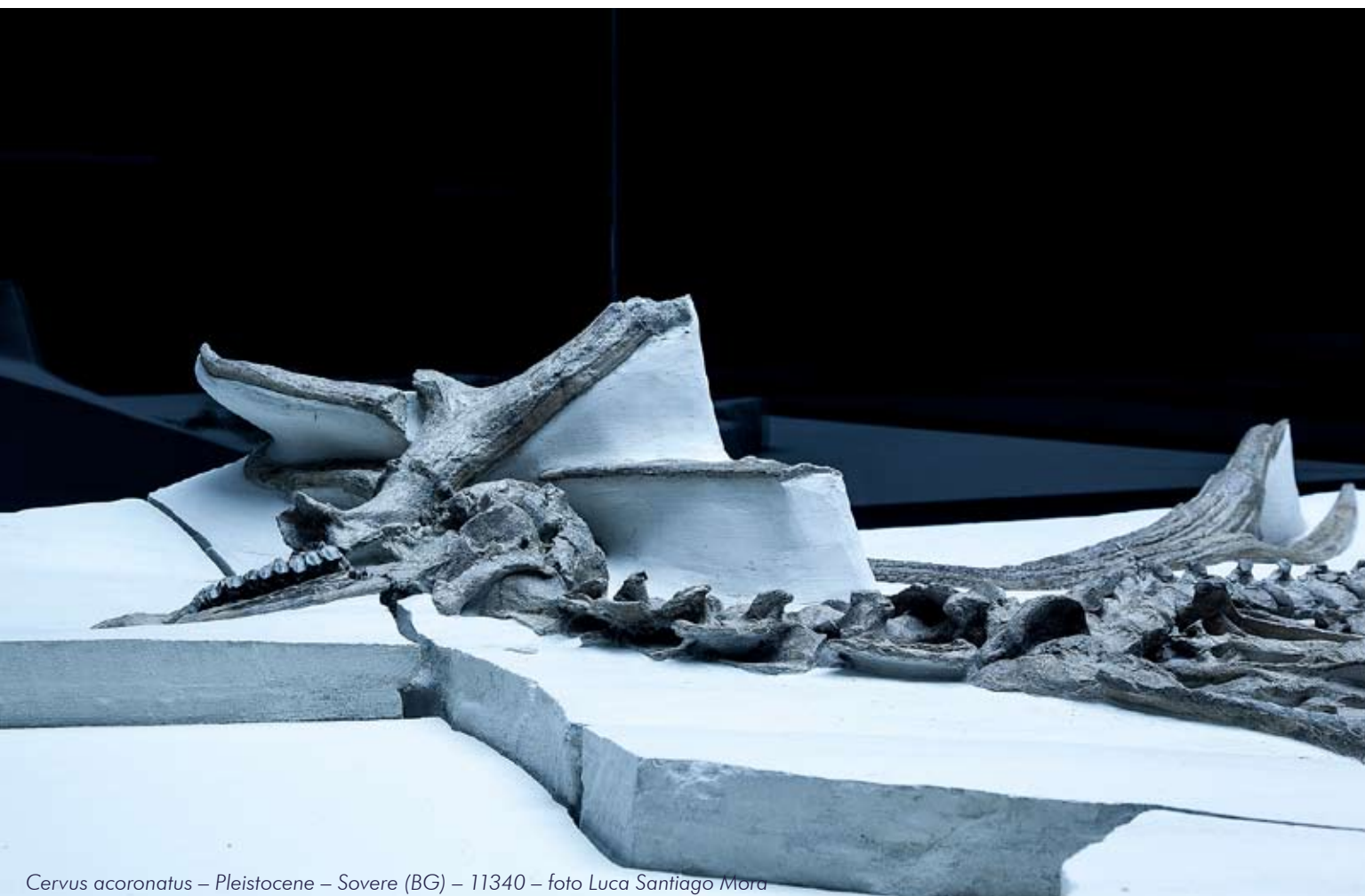
Cervus acoronatus – Pleistocene – Sovere (BG) – 11340