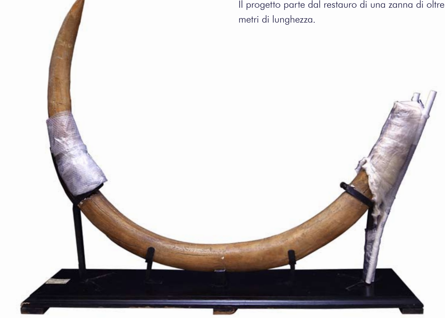
Zanna di mammut ( Mammuthus primigenius ) – Pleistocene – Petosino (BG) – foto Franco Valoti

La realizzazione di questo progetto prevede un insieme di interventi finalizzati al restauro conservativo di reperti fossili originali di mammut ( Mammuthus primigenius ) in vista dell'allestimento di una nuova area espositiva per il prossimo centenario del museo.