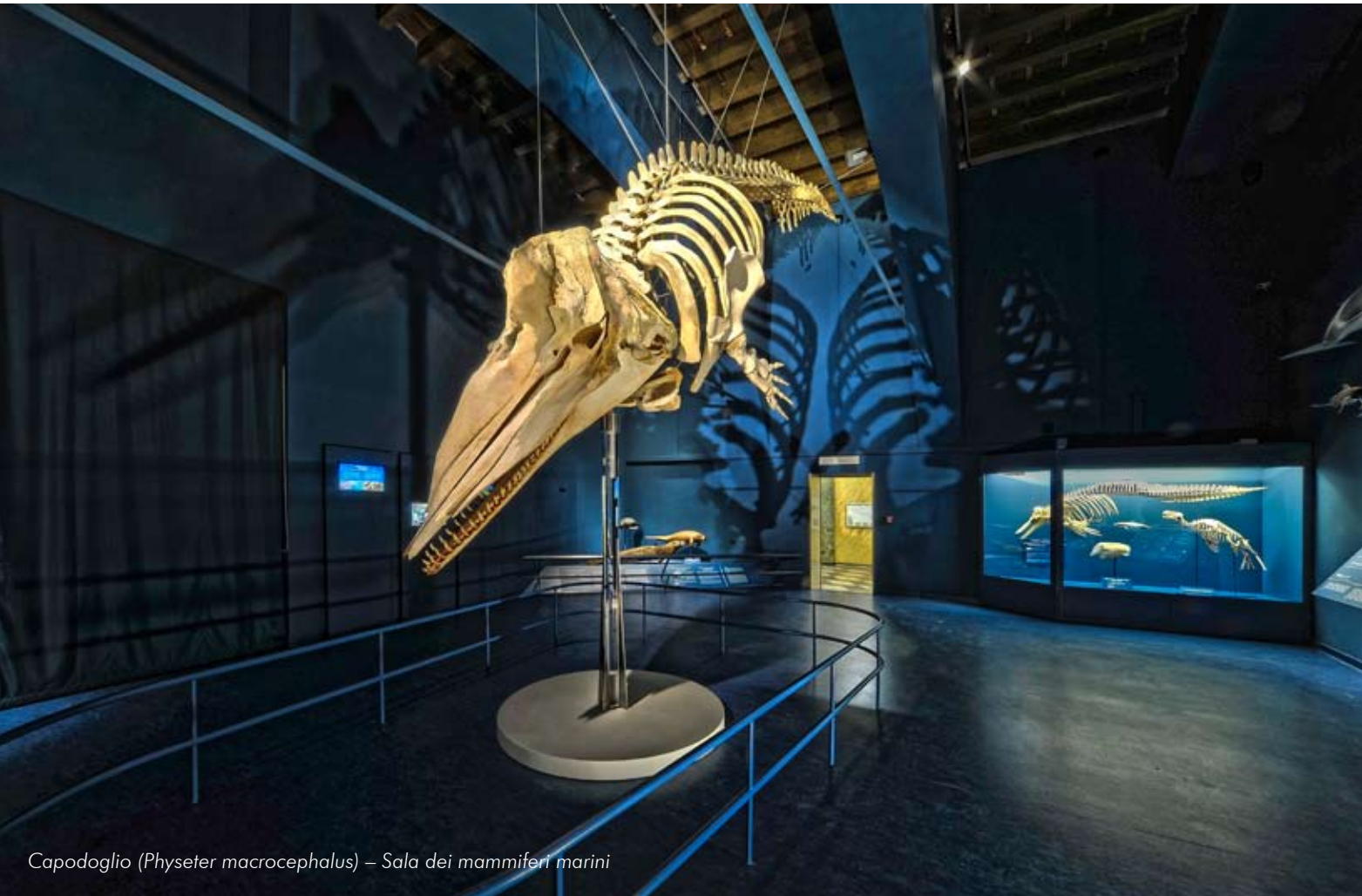
Capodoglio ( Physeter macrocephalus ) – Sala dei mammiferi marini