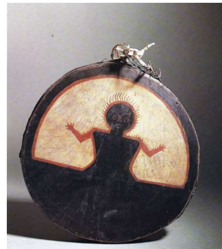
"Un Bergamasco tra i Sioux", 2005

Le ricerche effettuate per la realizzazione portano alla luce documenti inediti di grande importanza.