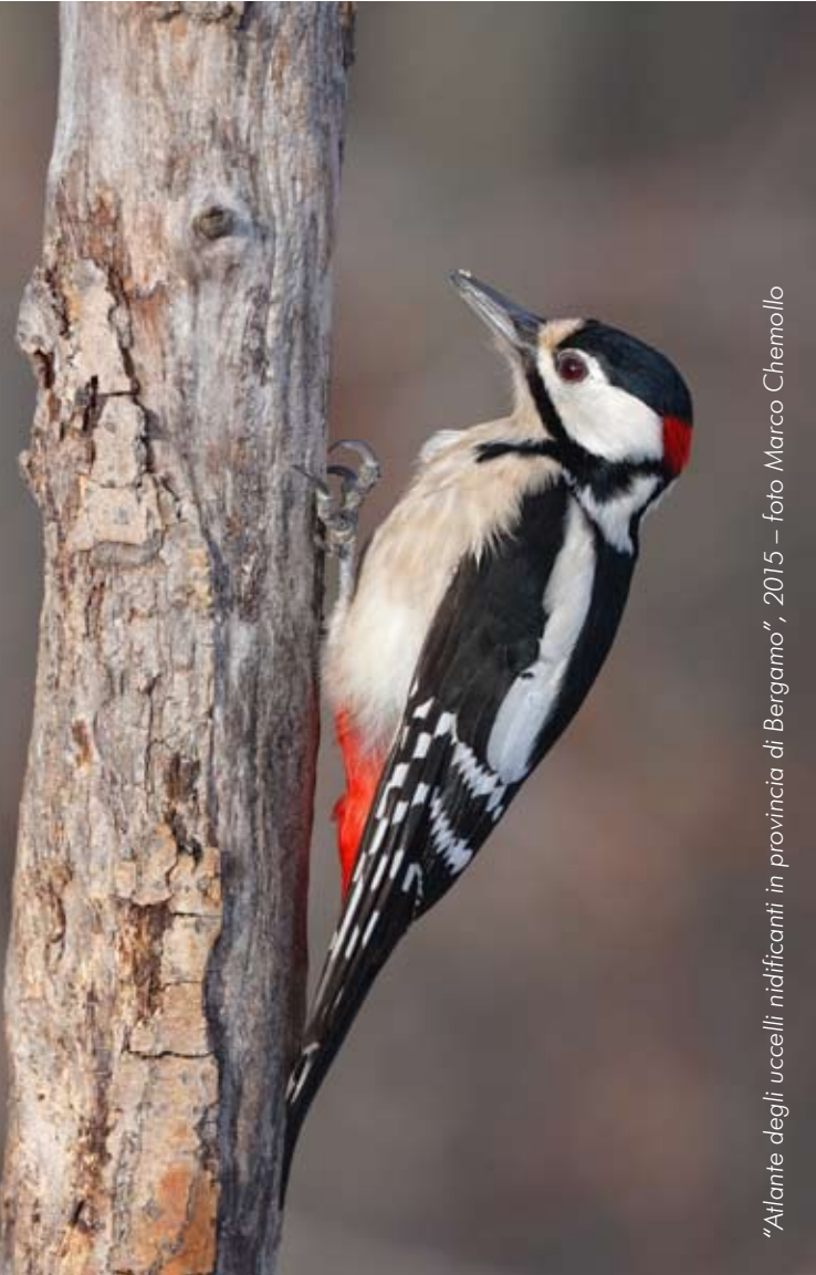
"Atlante degli uccelli nidificanti in provincia di Bergamo", 2015

Alcuni soci realizzano la "Guida alle Collezioni Etnografiche" che viene stampata grazie al finanziamento della Perofil.